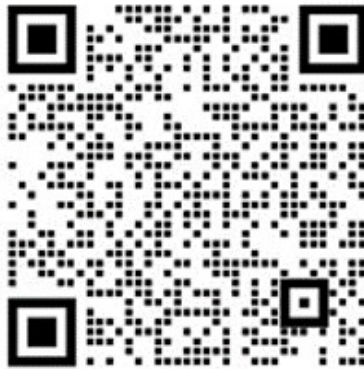
链工宝客服 2 (企业微信)