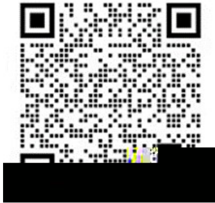
链工宝客服 1 (企业微信)